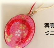
写真: ミニぞうりのチャーム